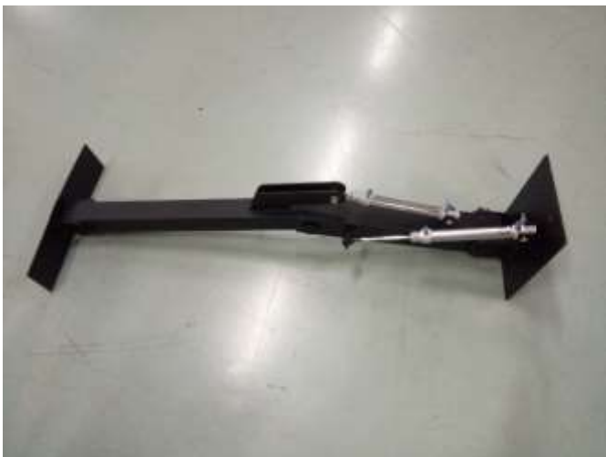
Figura 9: Braço mecânico raspador.

Pode-se observar que os braços articulados desenvolveram o movimento de raspagem conforme o proposto, porém o braço articulado dianteiro obteve uma limitação do movimento até o final do curso esperado, devido à dimensão do atuador pneumático disponível ser inferior ao espaço de movimento.