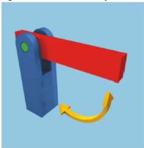
Figura 1: Juntas de rotação

O número de articulações em um braço mecânico é referenciado como graus de liberdade. Quando o movimento relativo ocorre em um único eixo, a articulação tem um grau de liberdade, quando o movimento é por mais de um eixo, a articulação tem dois graus de liberdade. A mobilidade dos braços depende do número de elos e articulações que o mesmo possui. Os braços podem ser formados por juntas deslizantes, juntas de rotação ou juntas de bola e encaixe, sendo que as mais usadas são a junta de rotação e a deslizante. As juntas de rotação permitem movimentos de rotação entre os dois elos, sendo que estes são unidos, permitindo o movimento de rotação entre eles, como acontece nas dobradiças das portas e janelas (Figura 1) (MOURA, 2004).