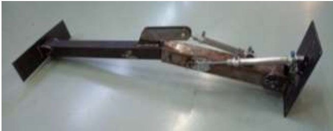
Figura 8: Braço mecânico raspador.