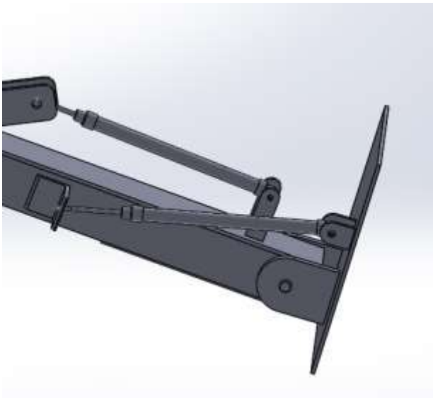
Figura 2: Fixação e acionamento braço mecânico.

Para realizar o acionamento dos articuladores foram utilizados dois atuadores pneumáticos, devido a ao baixo custo e longa vida útil, principalmente em ambientes agressivos.