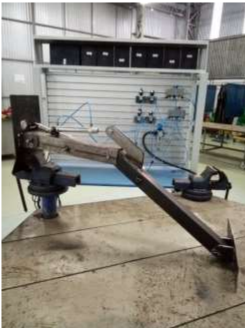
Figura 6: Teste do braço raspador mecânico através de bancada de acionamento pneumático.

Os testes de movimentação e simulação de limpeza foram efetuados através de uma bancada pneumática disponibilizada pela FAHOR.