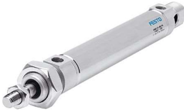
Figura 5: Atuador pneumático FESTO DSNU-20-100-PPV-A Máx. 10 bar.