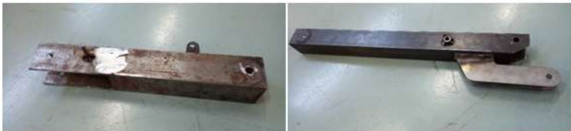
Figura 7: Braços articulados com elementos de fixação.

Por fim, montou-se o braço mecânico raspador tendo como base uma chapa metálica com medidas externas de 250 mm de comprimento e 175 mm de largura. A união dos componentes foi realizada através de juntas soldadas e mecanismos, usando como referência juntas de rotação.