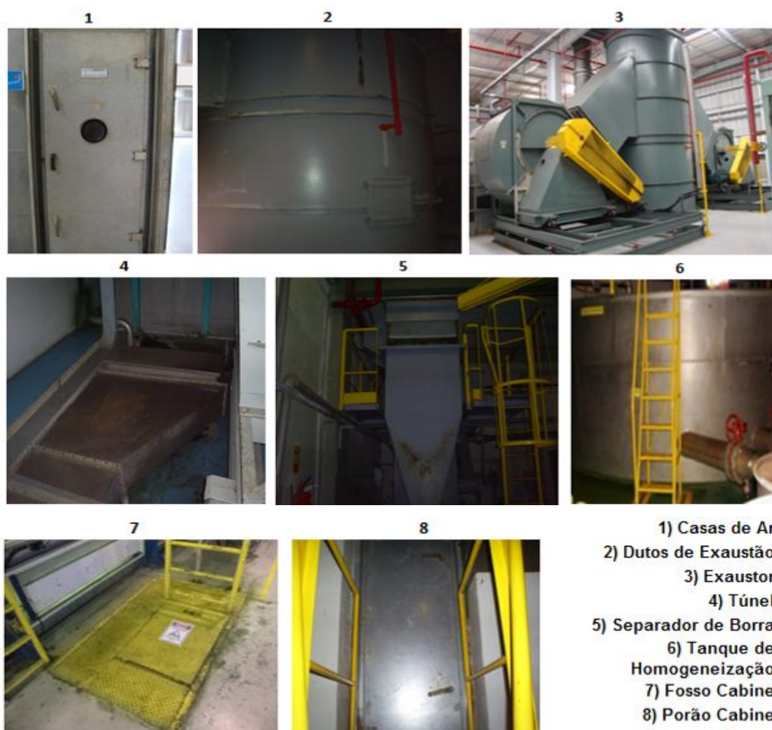
Figura 07 – Espaços confinados da empresa estudada.

Na figura 07 pode-se ter uma idéia mais detalhada de como são os espaços confinados citados acima, bem como a forma de acesso pela boca de visita (BV) dos mesmos, ou seja, a geometria da porta por onde os trabalhadores irão fazer o acesso ao espaço confinado.