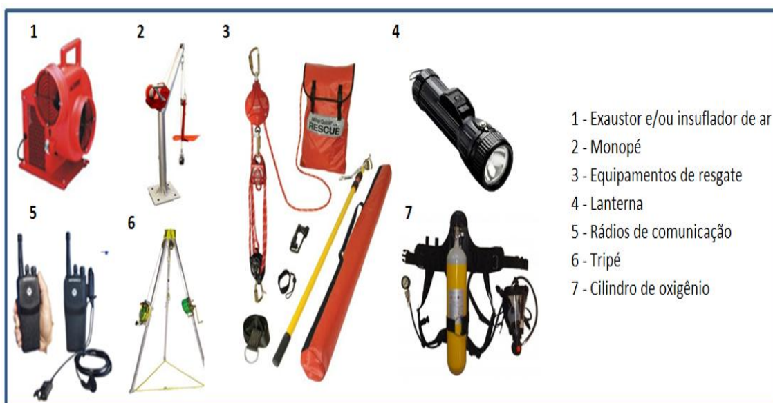
Figura 04 – EPC's para trabalho em espaço confinado.

Fonte: Adaptado de Santos, 2011, p. irregular.