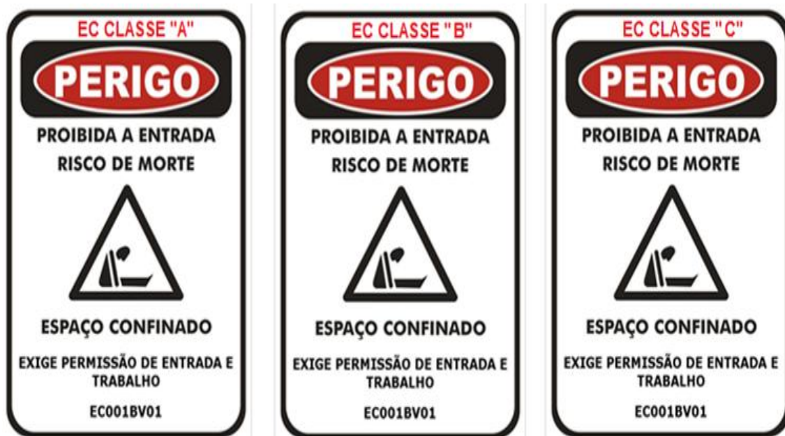
Figura 08 – Placa de Identificação classe A, B ou C.

figura 02 ilustrado anteriormente. Sendo assim, elaborou-se a figura 08 com algumas sugestões de melhoria, principalmente englobando os espaços confinados de classe A, B e C.