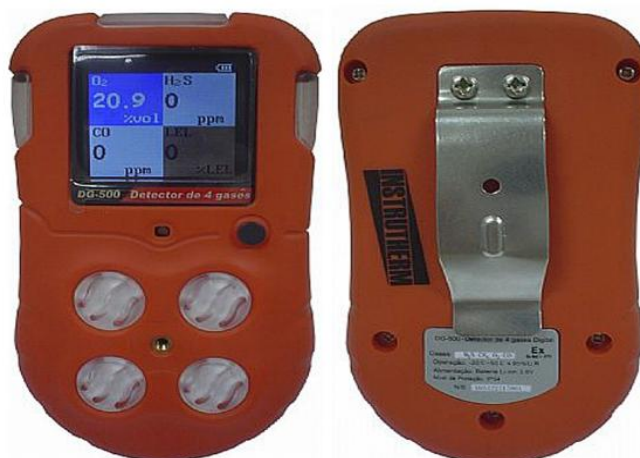
Figura 06 – Medidor multigás.

Conforme a figura 06, a análise atmosférica é realizada através de um aparelho portátil denominado medidor multigás.