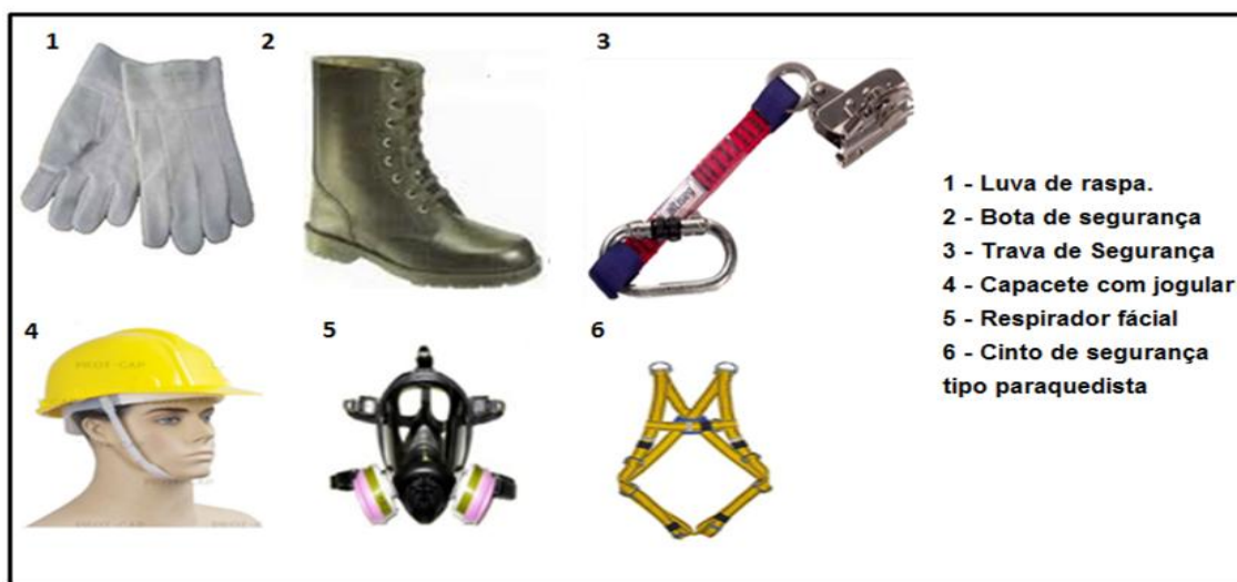
Figura 03 – EPI's para trabalho em espaço confinado.