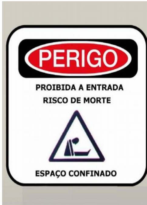
Figura 02 – Placa de identificação dos espaços confinados.